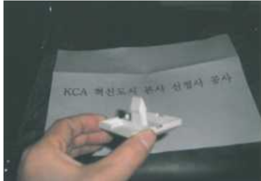
<시공사진 예시 4>

//////////////////////////////////// ※ GIS Data에서 처리되는 알고리즘입니다. //////////////////////////////////// class GISData { void checkMemoryUse() { ※ 현재 메모리 사용률이 70%이면 읽어들이는 GISData중 사용하지 않는 GISData를 제거한다. (1번 항목 참조) if (memory use >= 70%) { ※ 사용하지 않는 Data정보를 메모리에서 제거한다. for(GISData data : list) { if (!data.setUse) data.clear(); } } } void paint(width, height, minx, miny, maxx, maxy) { ※ 읽어들이는 GIS Data를 기반으로 도면에 GIS Data를 그립니다. } }