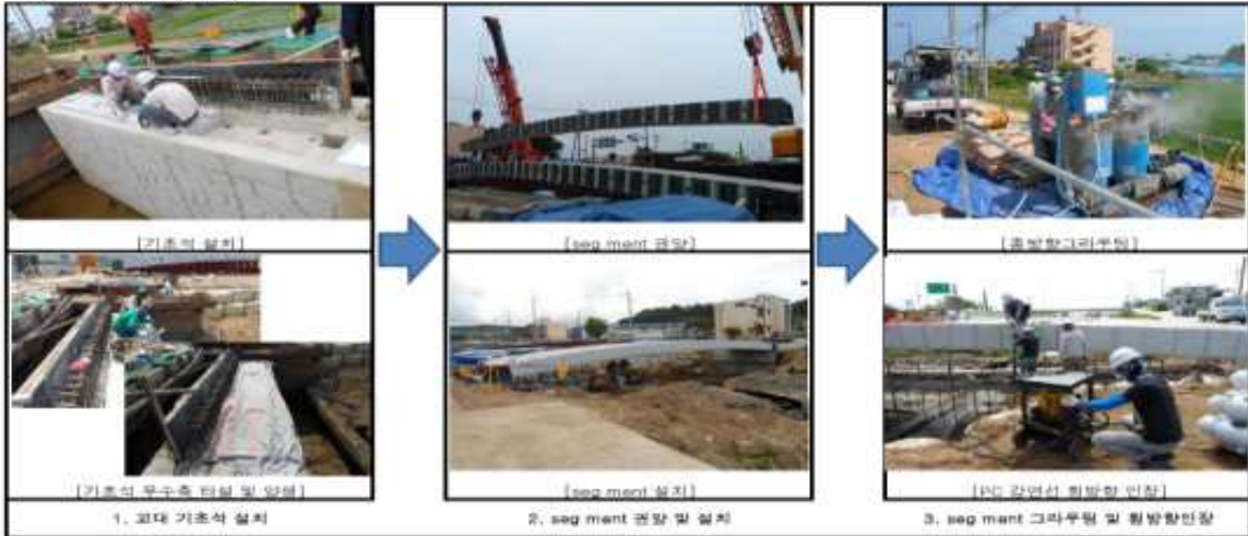
<시공사진 예시 3>